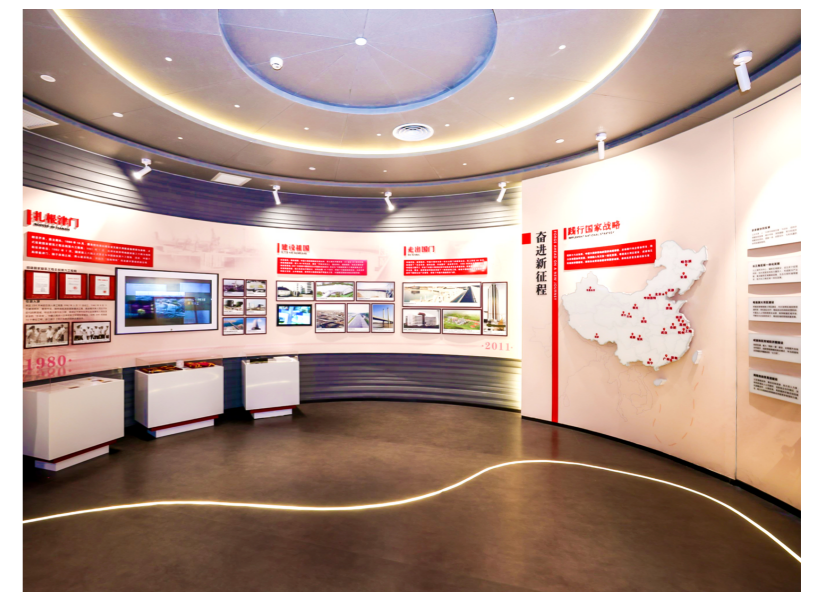
第二建设公司“海虹之光”微展厅

展厅以“厚德笃行 创新 共生”为主题，分为“岁月峥嵘 逐梦同行”“匠心铸造 共建共享”“不忘初心 同心共筑”“砥砺前行 共生未来”四个板块，通过一幅幅照片、一件件实物、一段段视频、一个个故事，全方位、多角度、立体化讲述了中建六局70年波澜壮阔的创业史、奋斗史、发展史，传承与生俱来的红色基因，宣传改革创新的发展成果，展示核心竞争力和战略愿景，弘扬企业始终“与祖国同奋进、与时代共成长”的赤子情怀。截至目前，展厅累计接待参观者近五千人，有力增强了干部职工的凝聚力、向心力和归属感，提升了品牌影响力。