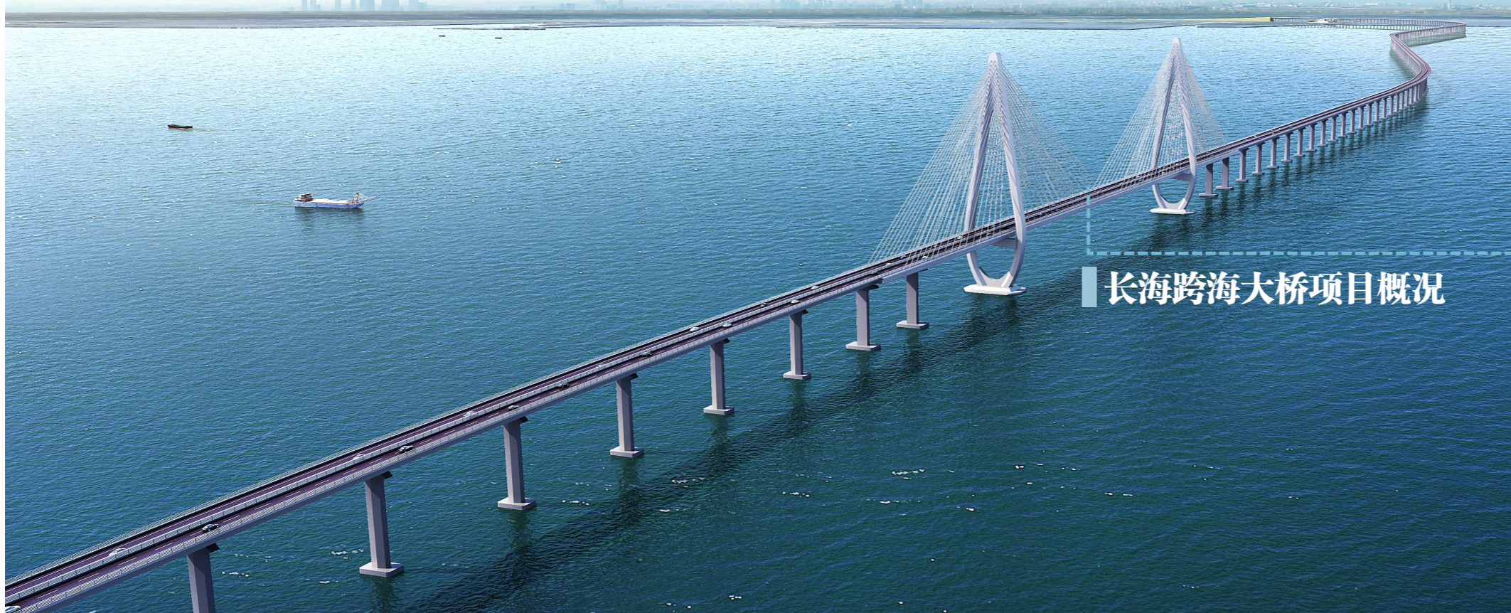
长海跨海大桥项目概况

大连市长海跨海大桥项目是东北地区首个采用政府与社会资本合作新机制(特许经营建设模式)建设的跨海大桥,由中建股份联合体中标(中建六局为联合体成员),负责总体投资、建设、运营,是央地合作的重要举措。项目是继浙江宁波舟山港主通道后,中建六局参建的又一座深海特大桥梁工程,将成为深海桥梁建造领域又一亮丽名片。