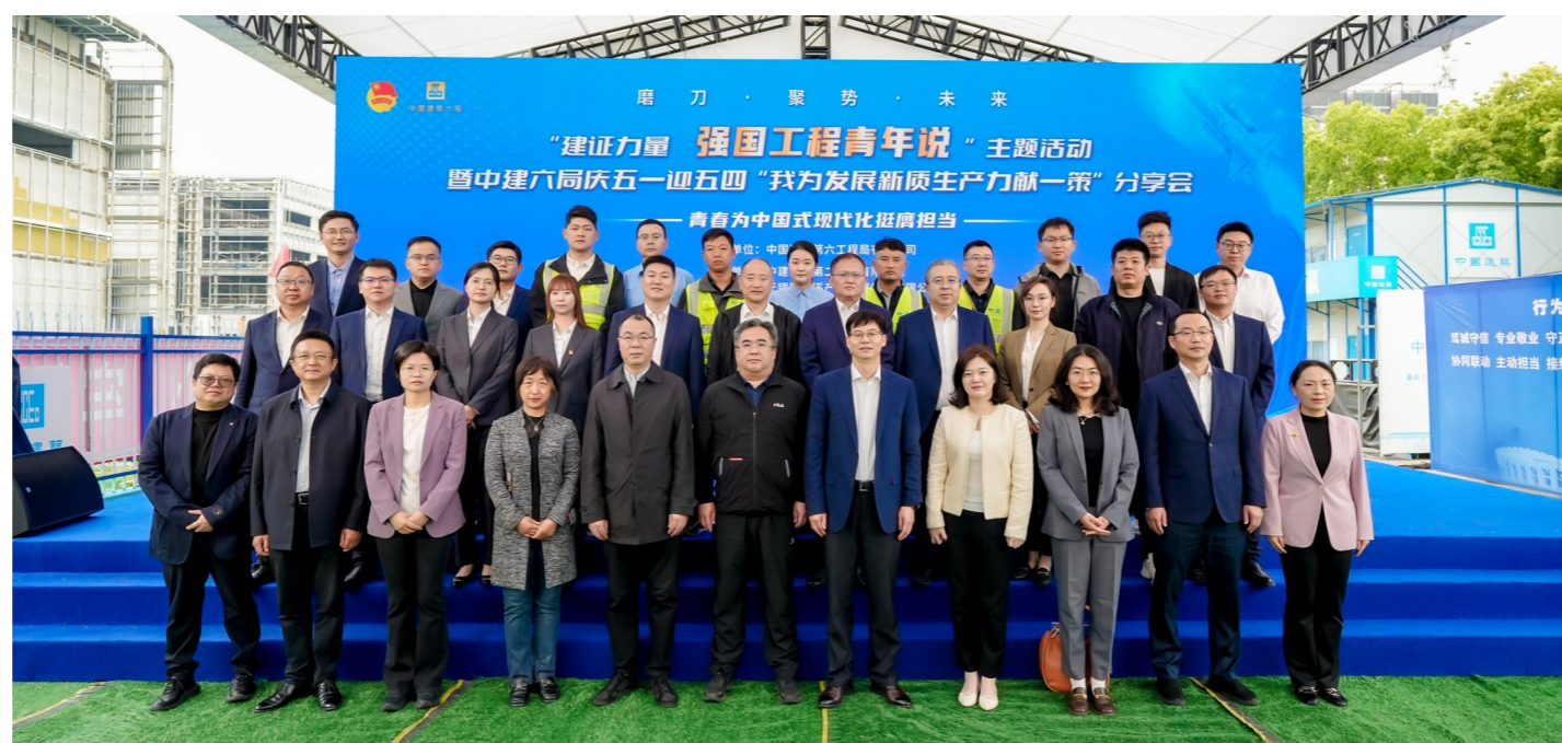
梁溪产业集团融腾党支部、东方空间(江苏)航天动力有限公司党支部签署党建共建协议。

中建六局二建公司与江南大学马克思主义学院共建的江南大学国有企业党建研究中心、江南大学思想政治理论课实践教学基地揭牌。中建六局东方空间液体火箭研制基地项目党支部、无锡市梁