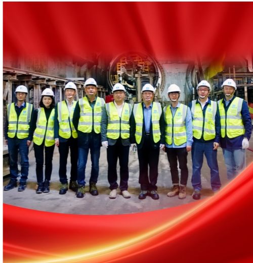
天津市模范集体 以色列特拉维夫绿线G3-2项目